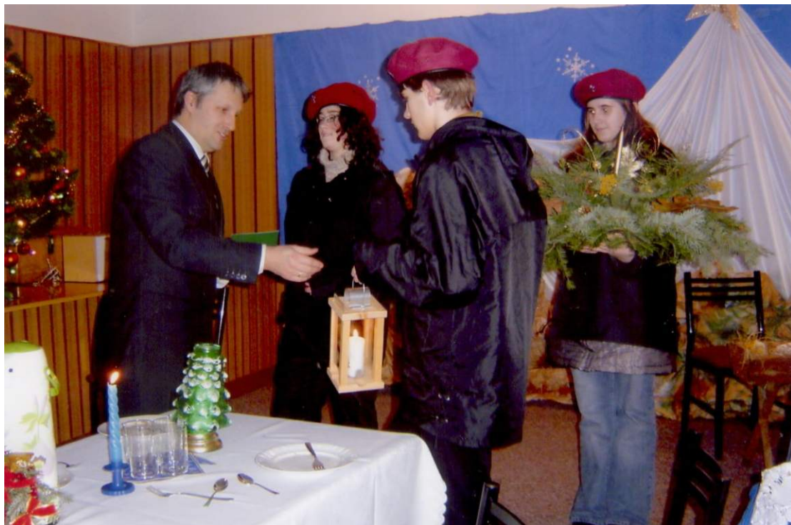
Przekazanie światełka betlejemskiego podczas Wigilii dla osób samotnych.