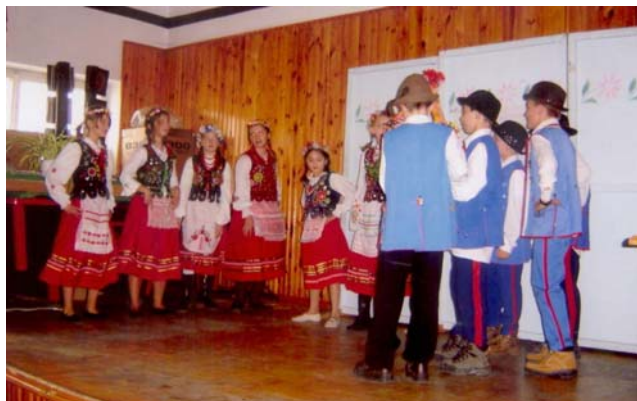
Obzęd weselny w wykonaniu uczniów SP Nr 2 podczas konkursu „Ocalić od zapomnienia”

Biblioteka jest instytucją kultury działającą w obrębie krajowej sieci bibliotecznej i stanowi sa- modzielną jednostkę organizacyjną.