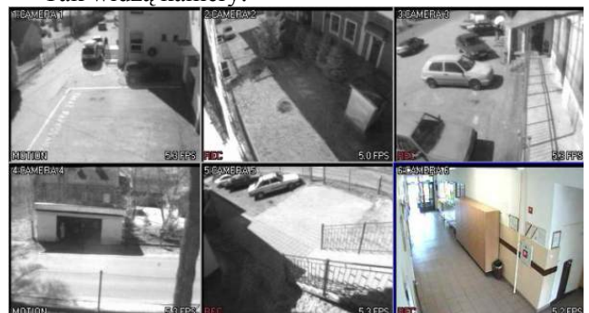
Tak widzą kamery.

W celu podniesienia bezpieczeństwa mieszkańców Gminy został zainstalowany nowoczesny system monitoringu. Sześć kamer przez 24 godziny obserwuje najważniejsze miejsca w centrum Chmielnika. Przydatność tego systemu już się sprawdziła, gdyż tylko w okresie 3 miesięcy od momentu zainstalowania kamer dwukrotnie mogliśmy rozstrzygnąć zdarzenia na korzyść pokrzywdzonych. Bez tego systemu byłoby to bardzo trudne, a może nawet wręcz niemożliwe.