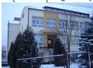
Sz P nr 3 w Chmielniku

W ramach priorytetu Zapewnienia równych szans edukacyjnych zostało powołane do życia Gminne Centrum Wspomagania Uczniów i Nauczycieli, które objęło doradztwem tych nauczycieli szkół z terenu gminy, którzy poszukują nowych form pracy dla uczniów z dysfunkcjami. Dwie panie psycholog i pani logopeda opracowały indywidualne programy pracy z uczniami dysfunkcyjnymi, przeprowadziły szkolenia dla rodziców i warsztaty szkoleniowe dla nauczycieli oraz prowadzą systematycznie zajęcia z grupami dzieci dyslektycznych, nie tylko w naszej placówce, lecz również w szkołach partnerskich.