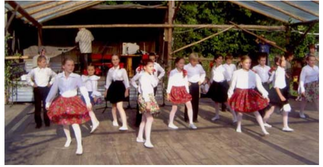
Dziecięcy zespół tańca ludowego.

Przy Gminnej Bibliotece Publicznej działają dziecięcy zespół tańca ludowego i kapela mające na celu rozwijanie kultury ludowej naszego terenu.