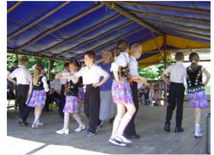
Dziecięcy zespół taneczny ze Szkoły Podstawowej w Zabratówce