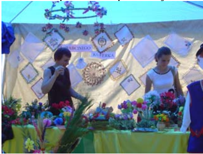
Wystawa prac uczniów Szkoły Podstawowej nr 3

Po zmaganiach turniejowych i wręczeniu pucharów odbyła się zabawa dla dzieci oraz festyn ludowy dla dorosłych.