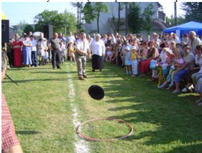
Rzut kapeluszem przez sołtysów