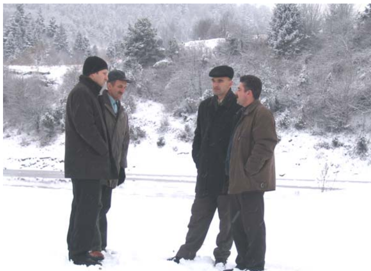
Fot. 1. Spotkanie władz zaprzyjaźnionych gmin nad Dniestrem

gminy znajdują się odkryte przed wojną, złoża wód sodowo-siarkowych, które to ekspertyza wydana przez naukowców z Truskawca uważa za lecznicze. W czasach przedwojennych Bukowisko znane było jako ulubiony teren wypo-