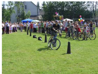
Ale jazda! – na rowerze