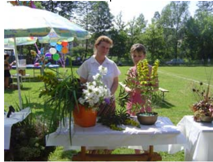
Kompozycje kwiatowe – konkurencja