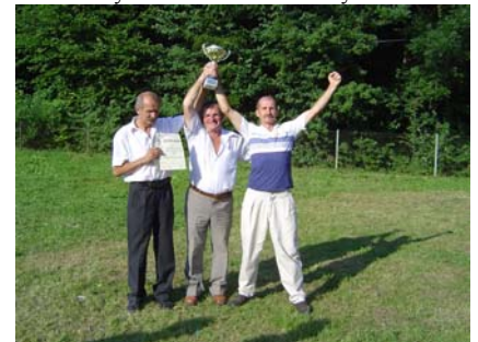
Uradowani zwycięscy Turnieju Sołectw