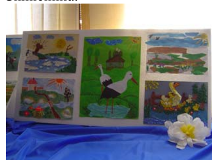
Konkursowe prace plastyczne