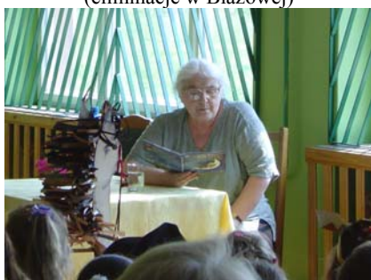
Spotkanie autorskie z Joanną Papuzińską