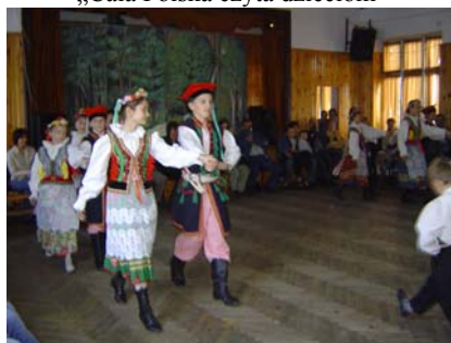
„Chmielnickie Kłosy” w rocznicę powstania zespołu