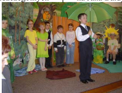
Teatr „Pod zielonym parasolem” w wykonaniu uczniów ze Sz. P. w Woli Rafałowskiej