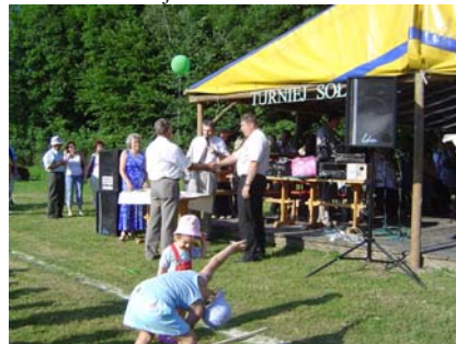
Wręczenie pucharów przez Wójta Gminy i Dyrektora Kancelarii Urzędu Marszałkowskiego