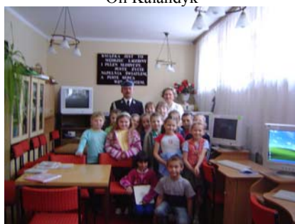
„Cała Polska czyta dzieciom”