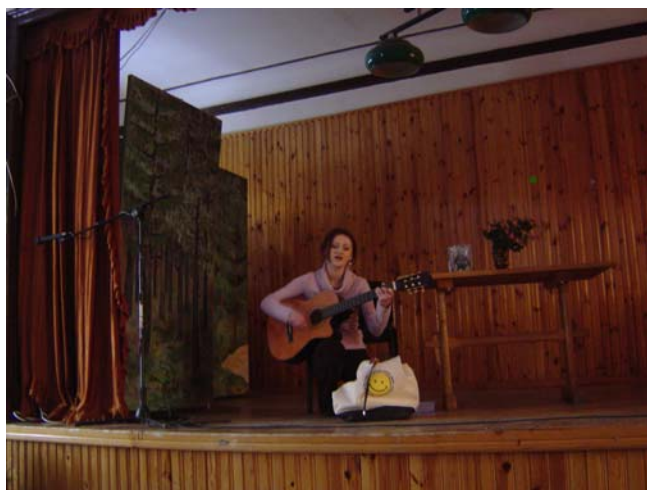
Koncert młodzieży z Borku Starego – zbiórka pieniędzy przeznaczona na zabezpieczenie usuwisko pod Klasztorem.