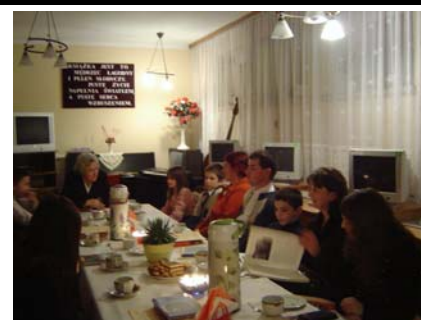
Dyskusja przy herbatce