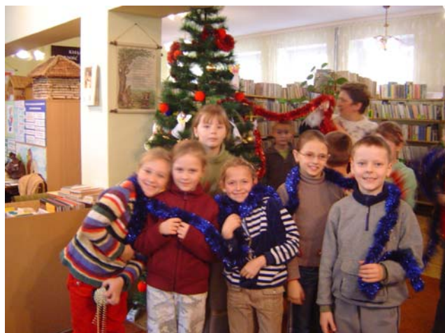
Radość drugoklasistów z ubierania choinki w Gminnej Bibliotece Publicznej w Chmielniku

Adwent jest czasem radosnego oczekiwania na Boże Narodzenie.