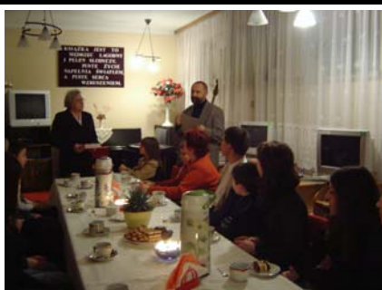
Uroczyste podsumowanie konkursu