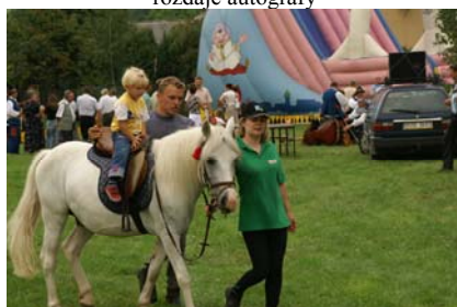
A najmłodsi ujeżdżali...