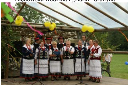
Śpiewano o wszystkim...