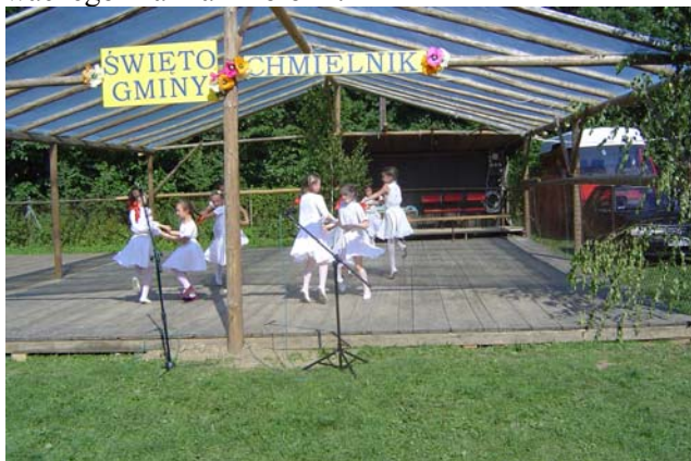
Najmłodsza grupa zespołu Chmielnickie Kłosy

Program artystyczny rozpoczął występ zespołu śpiewaczego Malina z Połomi.