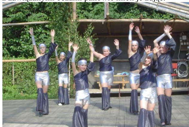
Występ grupy Sagat

W programie nie zabrakło konkursów dla młodszych i starszych uczestników festynu. Największe emocje przeżywaliśmy podczas Walki o Stówkę i podczas konkurencji, w której zadaniem panów było przypięć klamerki od bielizny na ubraniach żon, a następnie z zawiązanymi oczami panowie mieli je zdjąć.