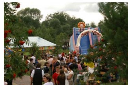
Chętnych do zabawy nie brakowało