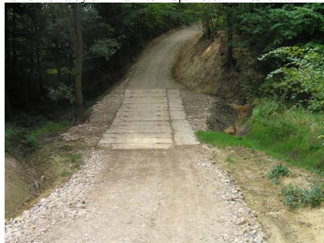
Odcinek drogi poscaleniowej Zabratówka -Pułanki

We wrześniu zakończono budowę oświetlenia drogi gminnej Nr 108251 Chmielnik – Malawa tzw. „Wielkopolska”. Wartość prac wyniosła 30 500,00 zł. Wykonawcą zamówienia była firma Eltor” Sp. z o.o. z Rzeszowa.