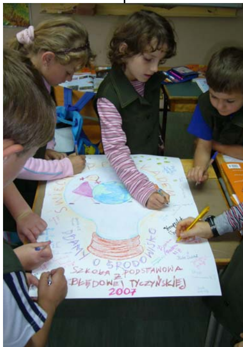
Nasze ekologiczne zobowiązania