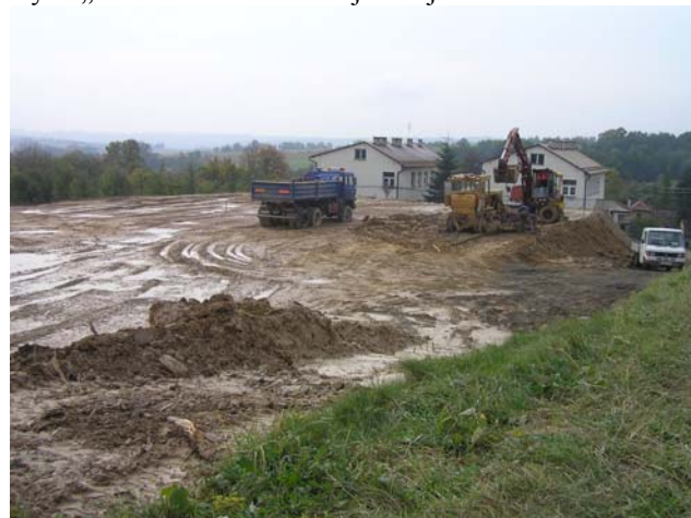
Plac budowy boiska przy Szkole Podstawowej w Woli Rafałowskiej

Rozpoczęto również prace przy podbudowie boiska z trawy syntetycznej przy Szkole Podstawowej w Woli Rafałowskiej w ramach programu „BLISKO BOISKO”. Wartość zamówienia wynosi 387 218,14 zł. Wykonawcą prac jest Podkarpackie Przedsiębiorstwo Robót Drogowych „DROGBUD” z Rudnej Małej.