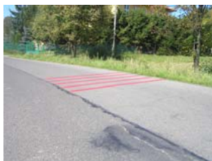
Linie wibracyjne zamontowane przy Szkole Podstawowej Nr 2 w Chmielniku (w tle widoczna szkoła)

Urząd Gminy Chmielnik informuje, że w związku z otrzymaniem dotacji prewencyjnej od PZU S.A w wysokości 8 500,00 zł zakupiono i zamontowano specjalistyczne zabezpieczenia na powierzchni