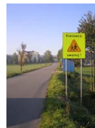
Tablica „Kierowco zwolnij” zlokalizowane w bezpośrednim sąsiedztwie Sz. P. Nr 3 w Chmielniku (szkoła widoczna w tle)

Mamy nadzieję, że podejmowane wspólnie z PZU S.A. działania prewencyjne przyczynią się do poprawy bezpieczeństwa dzieci i młodzieży w drodze do szkoły i powrocie do domu.