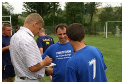
Znany piłkarz Wiesław Cisek rozdaje autografy