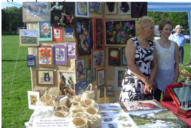
Kiermasz rękodzieła pensjonariuszy Domu Opieki Społecznej Caritas im. św. Ojca Pio

Dla mnie osobiście to Święto było niemałym wyzwaniem, gdyż przyszło mi organizować taką imprezę po raz pierwszy.