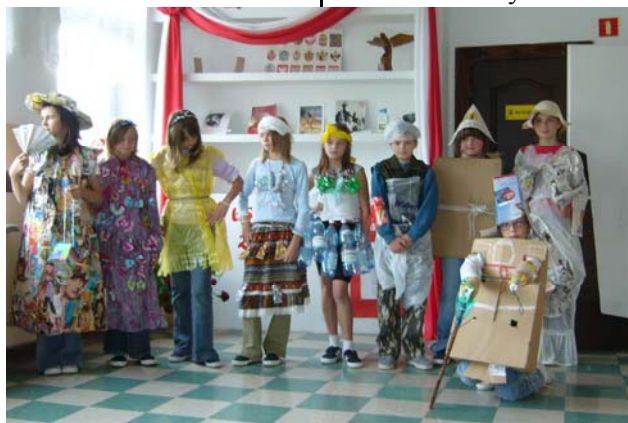
Odzyskuj i segreguj – „Śmieciomoda”