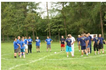
Rozpoczęcie meczu: Błędowska Rodzina i „Barki” drużyna