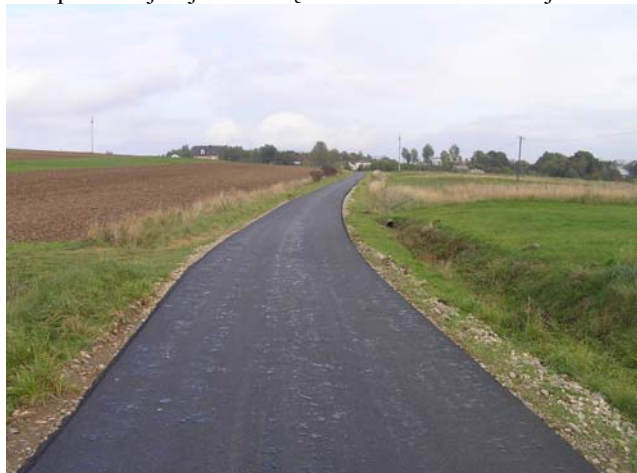
Przebudowywana droga Błędowa Tyczyńska – Krzywa – Zabratówka

Wszystkie w/w zadania są dofinansowane z rezerwy celowej budżetu państwa przeznaczonej na przeciwdziałanie skutkom klęski żywiołowych lub ich usuwanie, a zakres prac obejmuje budowę nawierzchni asfaltowej.