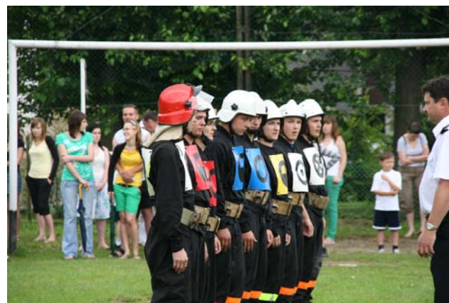
Zdobywcy II miejsca w kategorii drużyn męskich – OSP Błędowa Tyczyńska Krzywa

W konkurencjach z udziałem drużyn męskich rywalizacja była zacięta, ponieważ wszystkie sekcje były bardzo dobrze przygotowane do zawodów. Przebieg poszczególnych ćwiczeń był niejednokrotnie dramatyczny i zaskakujący, co było dodatkową atrakcją dla licznie zgromadzonych kibiców. Warto pokreślić, że zawody odbyły się w przyjaznej i sportowej atmosferze.