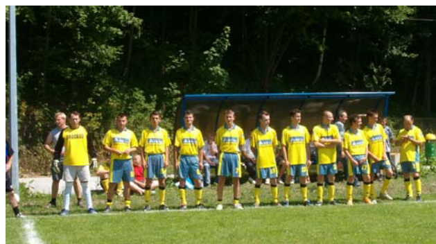
Drużyna Błędowej Tyczyńskiej