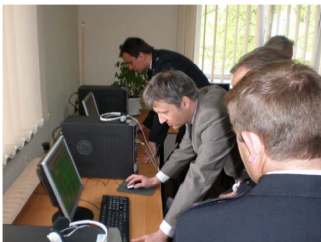
Pierwsze „kliknięcia” zaproszonych gości

Celem projektu jest przyczynienie się do zmniejszenia dysproporcji w zakresie dostępu do edukacji i możliwości podnoszenia kwalifikacji zawodowych pomiędzy mieszkańcami terenów wiejskich a mieszkańcami terenów miejskich. Działalność centrów umożliwi korzystanie z różnorodnych form edukacji zdalnej przez osoby zamieszkujące te tereny. Centra przewidują również organizowanie imprez kulturalnych i kulturalno-oświatowych, takich jak różnego rodzaju prelekcje, wykłady, pogadanki, prezentacje.