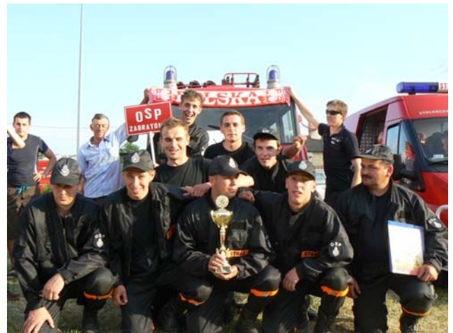
Drużyna męska OSP Zabratówka

W dniu 8 czerwca 2008 roku w miejscowości Kamień odbyły się V Powiatowe Zawody Sportowo-Pożarnicze Jednostek Ochotniczych Straży Pożarnych Powiatu Rzeszowskiego. Zawody rozegrane zostały w konkurencjach ćwiczenie bojowe i sztafeta pożarnicza 7 x 50m z przeszkodami dla dwóch grup: A (mężczyzn) i C (kobiet). W zawodach wzięło udział 9 drużyn kobiecych i 16 drużyn męskich grupy A. Jako przedstawiciel gminy Chmielnik startowała męska drużyna z OSP Zabratówka zajmując bardzo wysokie 3 miejsce.