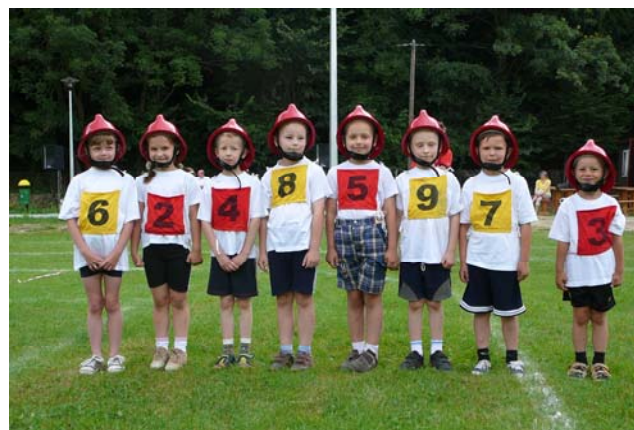
Najmłodszy strażacy OSP Zabratówka