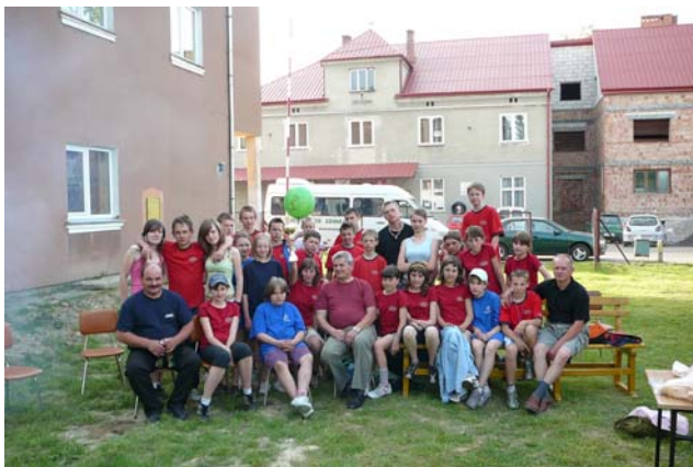
Młodzieżowe drużyny dziewcząt i chłopców OSP Zabratówka

W roku 2008 Komenda Powiatowa Państwowej Straży Pożarnej w Rzeszowie i Zarząd Powiatowy Ochotniczych Straży Pożarnych organizowały Powiatowe Zawody Sportowo-Pożarnicze, w których startowały najlepsze drużyny z poszczególnych gmin powiatu rzeszowskiego. Nie zabrakło wśród nich również drużyn OSP z terenu gminy Chmielnik.