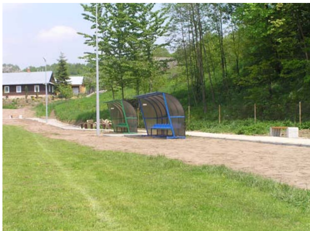
Ciąg komunikacyjny wzdłuż boiska

W maju bieżącego roku zakończono prace przy realizacji zadania „Rozbudowa gminnego zespołu sportowo – rekreacyjnego w Chmielniku – I etap”. W ramach zadania zrealizowano budowę ogólnodostępnego placu zabaw wraz z montażem urządzeń do zabaw dla dzieci (huśtawka podwójna, huśtawka podwójna wychyłna, urządzenie wielofunkcyjne „Tarzan”, piaskownica) wraz z ławkami. Ponadto wykonano ciąg komunikacyjny (nawierzchnia utwardzona z kostki brukowej) dla pieszych do placu zabaw i boiska sportowego oraz zamontowano wiaty stadionowe i ławki dla kibiców. Wolne od zabudowy powierzchnie przeznaczone na cele rekreacyjne (ławki, zieleń niska i średnia).