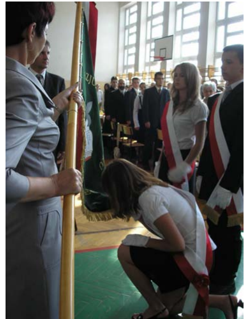
Przekazanie sztandaru przedstawicielom uczniów

skiej, którzy następnie, w imieniu wszystkich uczniów, złożyli ślubowanie na sztandar szkoły. Tak zakończył się ceremoniał nadania imienia Gimnazjum w Chmielniku. W dalszej części był poczęstunek oraz występ artystyczny w wykonaniu gimnazjalistów, a chór przepięknie wykonał Hymn Szarych Szeregów. Na zakończenie goście podzieliли się swoimi refleksjami, wpisując się do Kroniki Szkolnej.