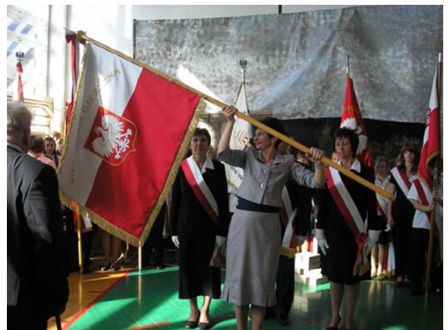
Prezentacja sztandaru przez Panią Dyrektor