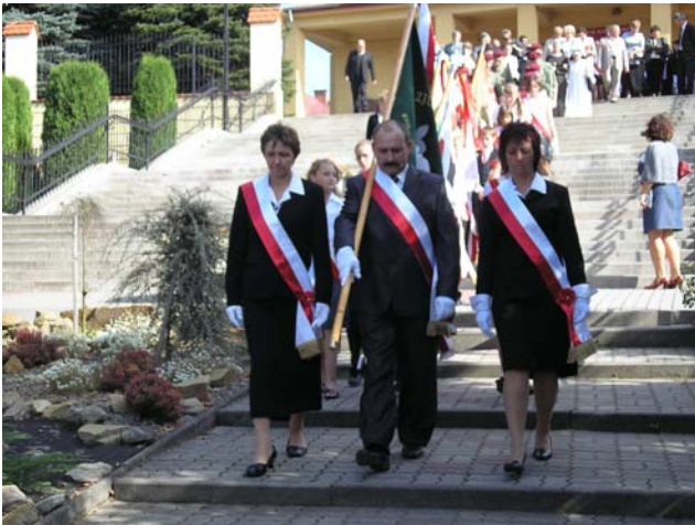
Przedstawiciele rodziców z poświęconym sztandarem