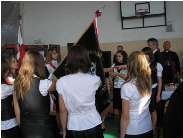
Ślubowanie uczniów na sztandar

Rok 2009 jest dla Gimnazjum rokiem wyjątkowym, zarówno z powodu obchodów 10 rocznicy jego powstania, jak i 70 rocznicy powstania „Szarych Szeregów”, która przypadała dzień po naszej uroczystości nadania imienia, tj. 27 września.