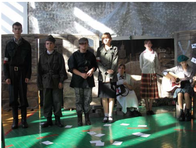
Gimnazjaliści w inscenizacji

Ale zacznijmy od początku. Nadanie imienia szkole to przecież nie tylko gala. Zaczęło się bardzo formalnie, aby wszystkie procedury urzędowe zostały spełnione. Tak więc 10 września b.r. w gimnazjalnej sali, w obecności Rady Pedagogicznej, Rady Rodziców oraz Samorządu Uczniowskiego odbyła się uroczysta sesja Rady Gminy Chmielnik, podczas której podjęto uchwałę o nadaniu Gimnazjum w Chmielniku imienia Szarych Szeregów.