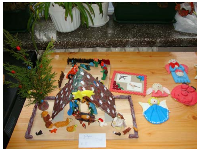
Opiekunka SU: Elżbieta Świerk

Na zakończenie otrzymali wielkie brawa, zaś na półroczu zostaną im wręczone dyplomy z mianem ucznia z pasją.