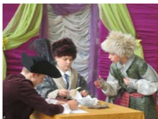
Inscenizacja (fragment Zemsty)