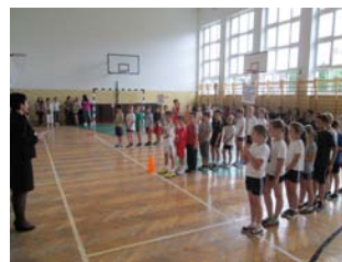
Spartakiada - drużyny ze szkół naszej gminy

Co się tyczy świadectw... Niech dominującym na nich kolorem będzie czerwień pasków. A z okazji zbliżających się wakacji życzymy Wszystkim Społecznościom Szkolnym gminy Chmielnik radosnego, ale spokojnego i bezpiecznego wypoczynku. Byśmy mogli spotkać się szczęśliwie po wakacjach i „rywalizować” na różnych polach konkursowych zmagających.