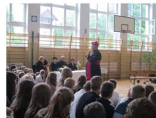
Wizyta ks. biskupa