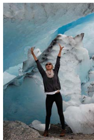
Lodowiec Nigardsbreen (Large)