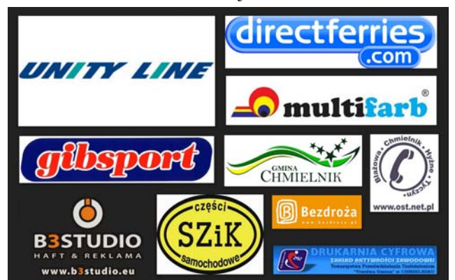
Partnerzy Nordkapp 2013

poprzednich wyjazdach mieli już Państwo okazję przeczytać na łamach „Wieści Gminnej”.