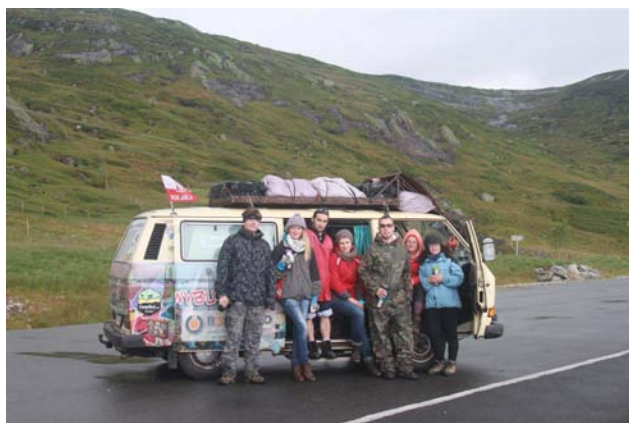
Norweskie góry (Large)