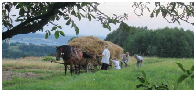
Fura ze snopami – Niecodzienny widok