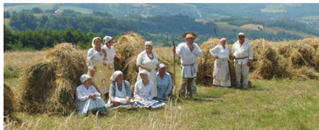
Grupa przy mondelach - Udało się wykonać plan