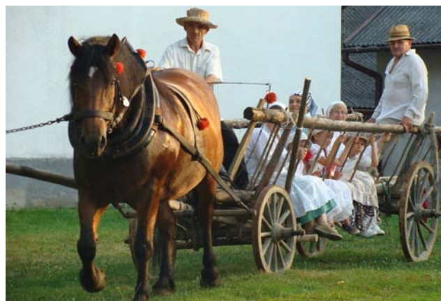
Grupa na wozie - Dużą frajdą była jazda w pole na wozie drabiniastym, na żelaznych kołach

Po dwóch tygodniach zboże zwieziono do stodoły i wymłócono cepami.