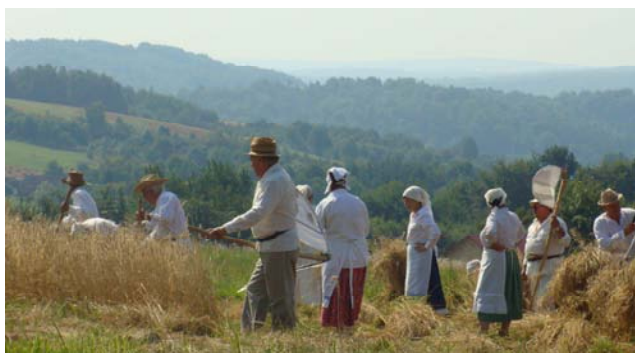
Grupa kosiarzy - Wszyscy ciężko pracują