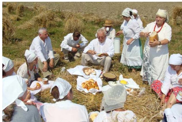
Wyjątkowo w polu, na sнопkach smakował positek, jużyna

Po dwóch tygodniach zboże zwieziono do stodoły i wymłócono cepami.