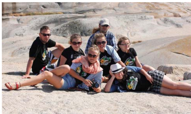
Verdens ende (Large)

Porvoo no i oczywiście Helsinki. W państwach nadbałtyckich zawitaliśmy do Tallina, Rygi i Wilna.