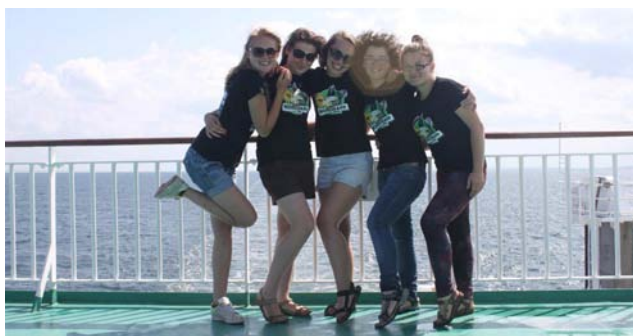
Prom Świnoujście - Ystad (Large)

Jesteśmy grupą podróżników o nazwie wyprawybussem.pl. Cztery lata temu stwierdziliśmy, że chcemy wyruszyć w świat na spotkanie przygodzie. Kupiliśmy samochód – starego, w miarę zadbanego VW T3 – odremontowaliśmy go i pół roku później latem 2011r. zaczęliśmy zwiedzać Europę. Nasza pierwsza podróż trwała niecały miesiąc. Odwiedziliśmy wtedy 4 państwa: Słowację, Węgry, Austrię i Czechy. Wraz z kolejnym rokiem nabraliśmy doświadczenia i pojechaliśmy nieco dalej: do Niemiec, Holandii, Belgii, Francji oraz Luksemburga. O naszych