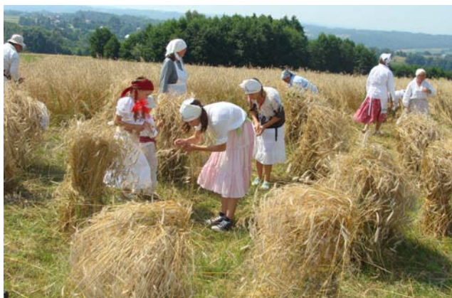
Pracujące dzieci - Zadaniem dzieci było nauczyć się robić porostła i zbierać kłóska, aby nic się nie zmarnowało