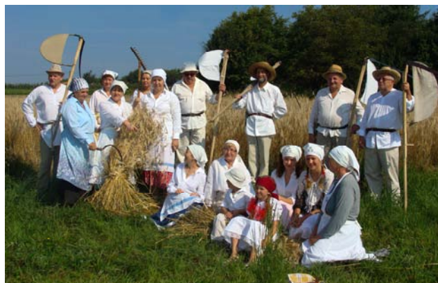
Cała grupa - Wszyscy uczestnicy żniw