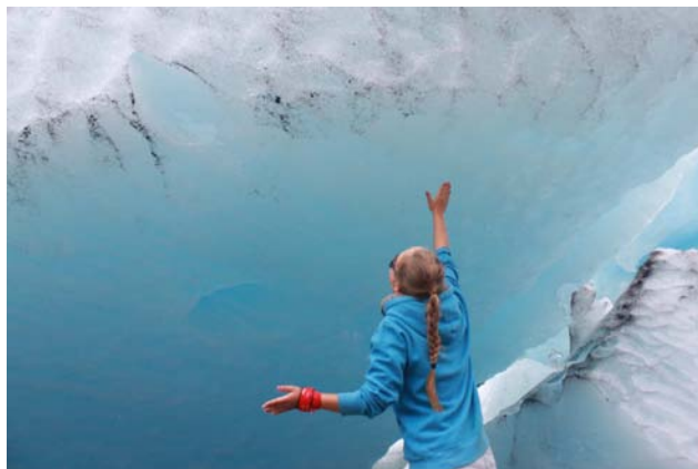
Lodowiec Nigardsbreen 2