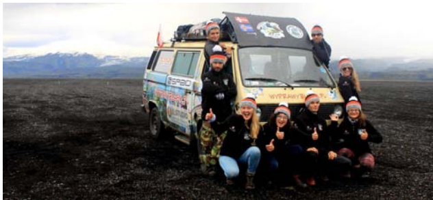
ISLANDIA - Czarne plaże w okolicach Viku

Wieczór był deszczowy i ponury, gdy 11 lipca tego roku wyruszyliśmy z Rzeszowa na 4 wyprawę w naszej dotychczasowej podróżniczej karierze. Potraktowaliśmy to jako dobry znak i zaprawę przed klimatem, jaki czekać nas miał u brzegów Islandii, która to - wraz z Wyspami Owczymi - stanowiła nasz tegoroczny cel. Wojażowe rzemiosło to dla nas nie pierwszyna. Jako grupa podróżnicza wyprawybusem.pl zwiedziliśmy już między innymi Europę Środkową, Zachodnią, czy też państwa leżące na Półwyspie Skandynawskim. W ekipie jest nas osiem osób, z czego połowa to mieszkańcy naszej Gminy Chmielnik.