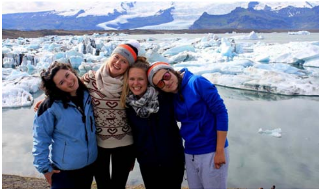
ISLANDIA - nad jeziorem polodowcowym Jokulsarlon

jotagja, która z powodu bardzo ciepłej wody może służyć jako sauna.