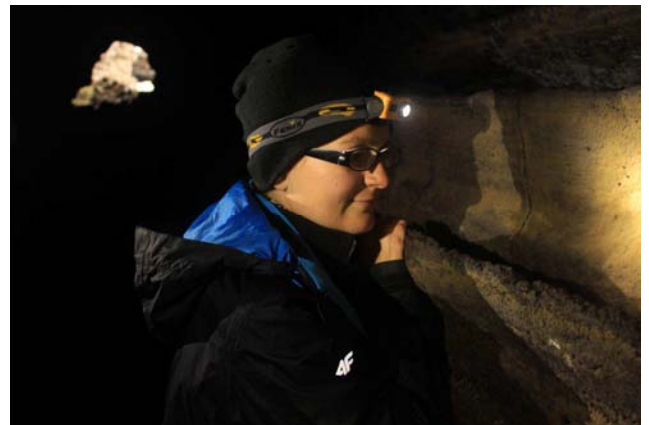
ISLANDIA - jaskinia Grjotagja

stwo i praktycznie każdy nowy dzień był dla nas pełny świeżych przygód. Już pierwszego dnia w Seyðisfjörður i okolicach mogliśmy podziwiać cudowny fiord malowniczo wcinający się w ląd, kilkunastometrowy wodospad i ośnieżone wzgórza ponad miasteczkiem, przez które wiodła nasza trasa. Potem przyszła pora na pierwszy trekking do turkusowych jezior (Storud). Trasa była łatwa, a przy tym niezwykle malownicza. Za plecami ocean i czarne plaże, z przodu górskie doliny, zaś u celu śnieg pokrywający dumne szczyty kryjące u podnóża właśnie owe turkusowe jeziora. Specyficznego klimatu całemu krajobrazowi dodawał absolutny brak drzew, co akurat na tej wyspie jest zgoła normalne. Nic tylko iść i nie narzekać, zwłaszcza, że pogoda była piękna zarówno wtedy, jak i praktycznie przez cały nasz pobyt na Islandii.