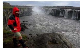
ISLANDIA - nad wodospadem Sellfoss

Środek Islandii to obszar w 100% dziki, pełen głązów, skał, trudnych do przebycia rzek czy lodowców. To miejsce, w które zapuszczają się tylko doświadczeni turyści z odpowiednim sprzętem. My mieliśmy okazję na krótką chwilę zboczyć nieco z trasy i wjechać na parę kilometrów w ten teren. Miejsca takie jak to skłaniają do przemyśleń. Sądymy, że na Islandii oprócz cudownych widoków i niezapomnianych przeżyć mieliśmy okazję również na coś więcej, na podróż w głąb własnej duszy – do swego własnego interioru. Surowy majestat i piękno tamtego świata pozwala nam teraz niektóre rzeczy doceniać bardziej.