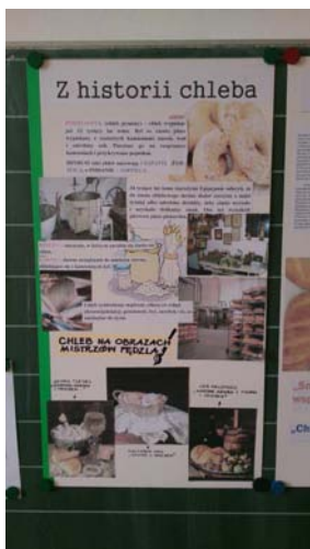
Projekty na temat historii chleba, jego poprzedników „podpłomyków” oraz jako tematu w malarstwie

kawałeczku i częstował wszystkich nauczycieli oraz młodszych i starszych kolegów, koleżanki.