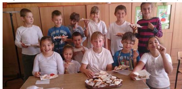
Klasa III podczas degustacji różnego rodzaju pieczywa.

„Chleb” to słowo bardzo proste, ale kryje się za nim trud oraz umiejętności wielu ludzi. Jednocześnie mówi o tym, że nie wszyscy go mają i należy się nim dzielić. Zajęcia kultywujące tradycję bardzo podobały się trzecioklasistom, którzy za św. Bratem Albertem powtórzyli, że chleb dla wszystkich powinien leżeć na stole, aby każdy mógł kęs dla siebie ukroić i nakarmić się, jeśli jest głodny.