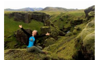
ISLANDIA - trekking po górach