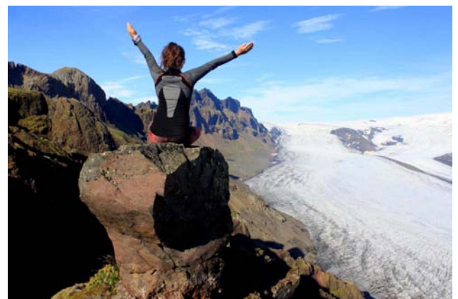
ISLANDIA - widok na lodowiec w Parku Narodowym Skaftafell

Wszystkich zainteresowanych naszym projektem zapraszamy na fanpage na facebooku: www.facebook.com/wyprawybusempl