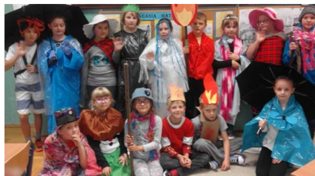
Nauczyciel SP nr 3

W czasie wieloletnich działań prowadzonych przez nauczycieli naszej szkoły nawiązano współpracę z wieloma instytucjami i organizacjami, np.: Związek Komunalny Wisłok, Schronisko Kundelek, Koło Łowieckie „Sarenka” z Błazowej, Gospodarka Komunalna w Błazowej, Regionalne Towarzystwo Rolno-Przemysłowe „Dolina Strugu”.