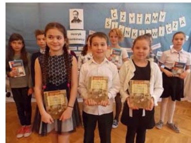
*22 XII 2016 r.- Szkolne jasełka- wigilia. Przegląd kolęd.