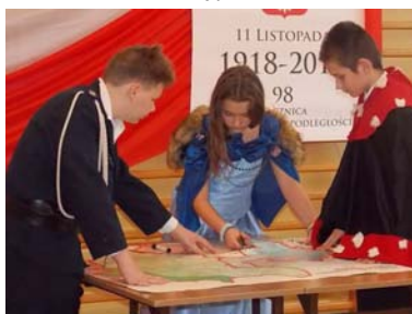
*10 XI 2016 r.- Uroczysty apel z okazji rocznicy odzyskania niepodległości,