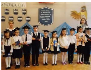
*17 X 2016 r.- Pasowanie na ucznia klasy pierwszej,