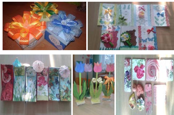
Wychowankowie i Wychowawca Świetlicy Środowiskowej