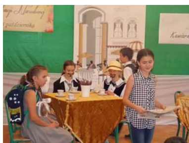
*13 X 2016 r.- Apel z okazji Dnia Edukacji Narodowej,