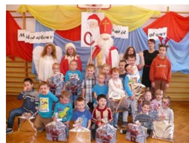
* 6 XII 2016 r.- Spotkanie z Mikołajem,