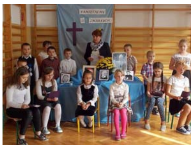
*28 X 2016 r.- Apel z okazji Wszystkich Świętych,