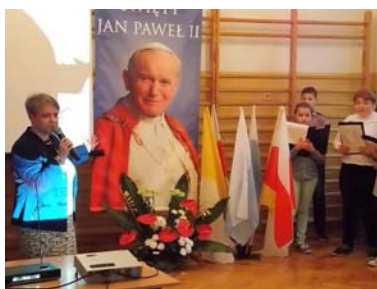
*20 X 2016 r.- Apel poświęcony Janowi Pawłowi II,