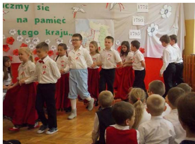
Mamo! Tato! Dziękujemy wam za piękne wspomnienia!