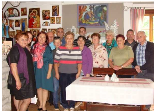
Spotkanie w „Krasnej Chacie” – z przedstawicielami Stowarzyszenia Lokalna Grupa Działania „Krasnystaw

belskie, podczas którego spotkały się z przedstawicielami różnych podmiotów ekonomii społecznej.