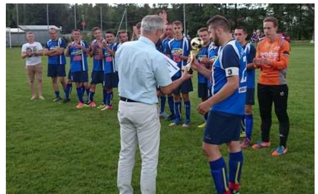
Chmielnik – zdobywca Pucharu Wójta Gminy 2017

Wszystkich zainteresowanych mieszkańców, kibiców piłki nożnej i sympatyków drużyn zapraszamy do liczego udziału we wszystkich meczach turnieju oraz do aktywnego i kulturalnego kibicowania dla swoich zawodników.