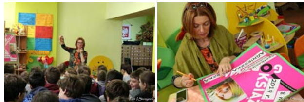
Oprac. Irena Szczypek

dwóch lat w bibliotece w Chmielniku Dyskusyjnego Klubu Książki dla dzieci.