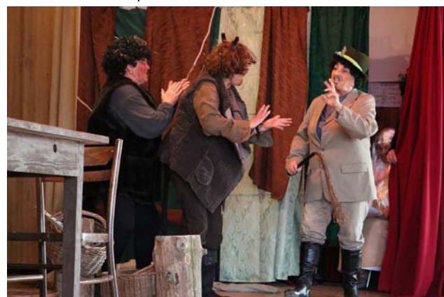
Irena Szczepiek Gminna Biblioteka Publiczna w Chmielniku