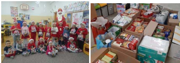
"Mikołajki 2020" dla Podkarpackiego Hospicjum dla Dzieci

7 grudnia dzieci z oddziału przedszkolnego podekscytowane od rana wyczekiwały Świętego Mikołaja, nasłuchując radosnego okrzyku „Ho, ho, ho!”. W końcu rozległo się mocne pukanie do drzwi i stanął w progu ON... ŚWIĘTY MIKOŁAJ!!! Radość ogarnęła wszystkich. Mikołaj obdarował dzieci prezentami, a one w podzięcie zaśpiewały radosne piosenki. Atmosfera spotkania była magiczna.