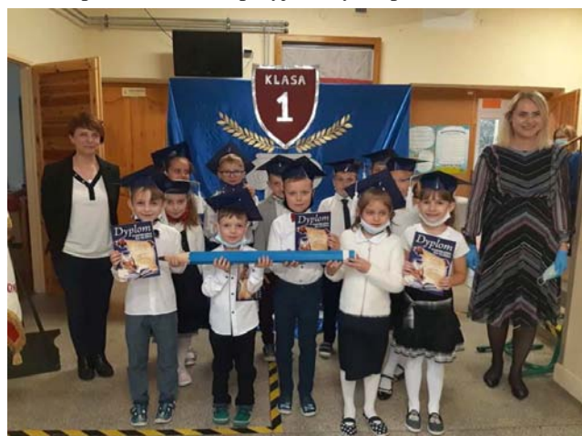
Pasowanie pierwszoklasistów na uczniów

Ślubowanie klasy pierwszej to niezwykła uroczystość szkolna, na którą pierwszoklasiści oczekują z wielką niecierpliwością. Jest to ogromne przeżycie nie tylko dla dzieci, ale również dla ich rodziców i nauczycieli. W tym roku w poczet uczniów przyjęliśmy 13 pierwszoklasistów.