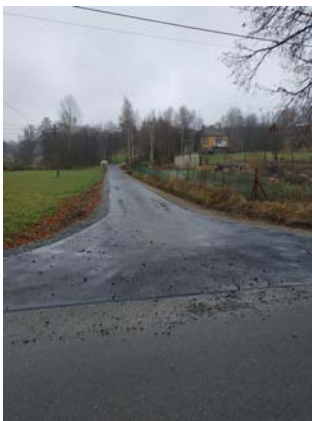
Przebudowa drogi gminnej w km 0+000 - 0+910 na działce nr ewid. 272 w miejscowości Błędowa Tyczyńska