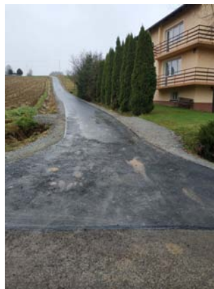
Przebudowa drogi gminnej w km 0+000 - 0+160 na działce nr ewid. 1487 w miejscowości Błędowa Tyczyńska

Rok bieżący był okresem intensywnych robót drogowych mających na celu podniesienie parametrów technicznych dróg na terenie Gminy Chmielnik, a tym samym komfortu korzystania przez mieszkańców z ulepszonych nawierzchni. Realizacja inwestycji drogowych podzielona była na dwie grupy. Pierwszą stanowią drogi realizowane w ramach dofinansowanych ze środków budżetu województwa stanowiących dochód z tytułu wyłączenia gruntów z produkcji rolniczej w roku 2020 tzw. „drogi poscaleniowe”.