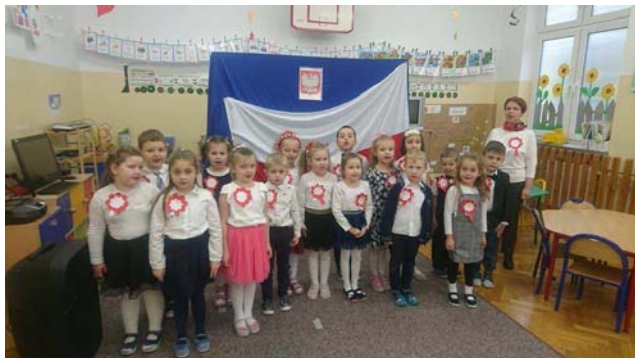
"Mazurek Dąbrowskiego" w wykonaniu przedszkolaków

Już po raz kolejny nasza szkoła wzięła udział w akcji SzkołaDoHymnu. Akcja odbywa się w przeddzień Narodowego Święta Niepodległości - 10 listopada o symbolicznej godzinie 11.11. Ze względu na ograniczenia wynikające ze stanu epidemii i naukę na odległość uczniowie i nauczyciele połączyli się za pomocą platformy Teams i podczas zajęć wspólnie zaśpiewali "Mazurka Dąbrowskiego" w formie on-line.