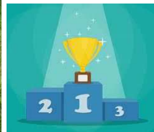
Krzysztof Siwiec kl. III - Szkoła Podstawowa nr 1 im. Por. Jana Bałdy w Chmielniku