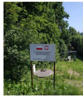
Studnia pomiarowa Wola Rafałowska - Michałki

O kolejnych inwestycjach i remontach prowadzonych na terenie naszej gminy w następnych numerach wieści.