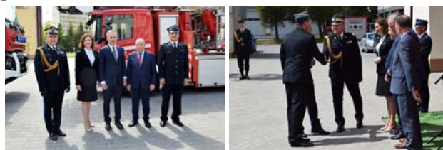
Zarząd OSP Zabratówka