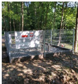
Przepompownia ścieków PK 14 Chmielnik – Donatka

W tym miejscu chcemy podziękować wykonawcy za fachowe, bezkonfliktowe i elastyczne prowadzenie prac oraz inspektorowi nadzoru inwestorskiego za zaangażowanie w rozwiązywanie wszelkich utrudnień terenowych, rozwiązań technicznych i elastyczność w terminach spotkań na budowie. Nadzór inwestorski nad realizacją zadania prowadził Zakład Usług Instalacyjnych „SANRES” Tadeusz Płonka, 35-310 Rzeszów, Al. T. Rejtana 10A.