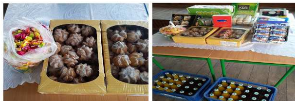
Irena Międlar - SP3 w Chmielniku