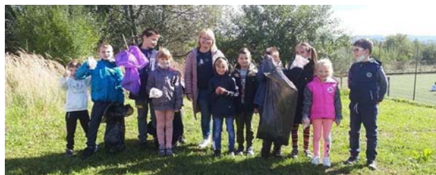
SP Wola Rafałowska