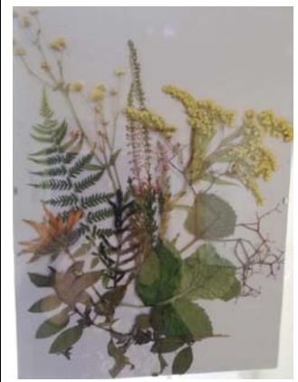
SP Wola Rafałowska