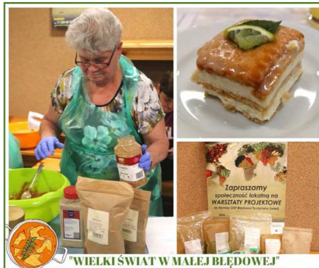
"WIELKI ŚWIAT W MAŁEJ BŁĘDOWEJ"