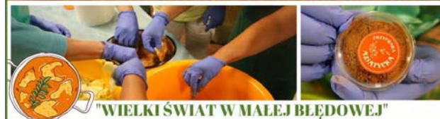
"WIELKI ŚWIAT W MAŁEJ BŁĘDOWEJ"