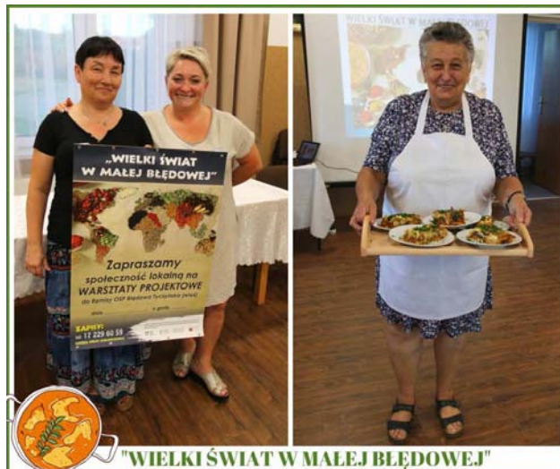
"WIELKI ŚWIAT W MAŁEJ BŁĘDOWEJ"

„Projekt realizowany w ramach Narodowego Programu Rozwoju Czytelnictwa 2.0 na lata 2021 – 2025 Priorytet 4, Kierunek interwencji 4.1 BLISKO – Biblioteka/Lokalność/Inicjatywy/Społeczność/Kooperacja/Oddolność”.