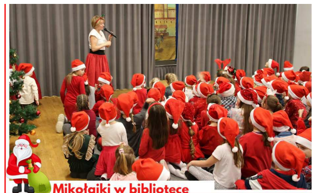
Mikołajki w bibliotece

"Dofinansowano ze środków finansowych Gminnego Programu Profilaktyki i Rozwiązywania Problemów Alkoholowych."