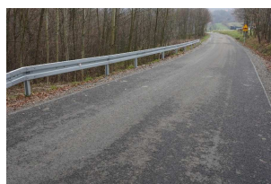
Droga nr 108263R Chmielnik – Kozia Góra w km 0+000 – 1+447