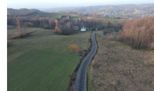
Droga Chmielnik – Jarząbki – Zawodzie w km 0+000 – 0+890