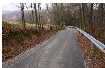
Droga Zabratówka Górna Wieś – Handzlówka II w km 0+000 – 0+640