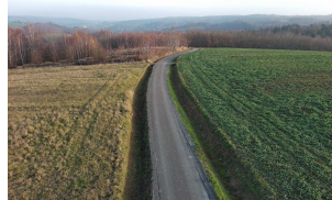
Droga Błędowa Tyczyńska – Zawodzie - Borówki w km 0+000 - 0+900

W celu zobrazowania zadania kilka zdjęć zrealizowanych dróg.