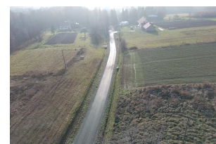
Droga nr 108225R Grodzisko – Chmielnik – Wola Rafałowska w km 2+672 – 3+032