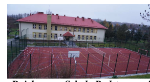
Boisko przy Szkole Podstawowej nr 2 im. Ojca Świętego Jana Pawła II w Chmielniku