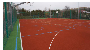
Boisko przy Szkole Podstawowej nr 1 im. por. Jana Bałdy w Chmielniku

Kilka ujęć nowych i zmodernizowanych obiektów