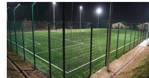
Boisko przy Szkole Podstawowej w Woli Rafałowskiej