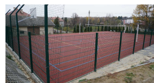
Boisko przy Szkole Podstawowej w Zabratówce