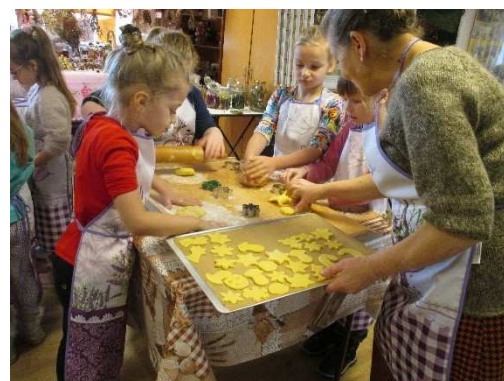
Przedszkolaki na podsumowanie udziału w projekcie upiekły pyszne ciasteczka.