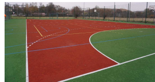
Boisko przy Szkole Podstawowej nr 3 im. Św. M. M. Kolbego w Chmielniku