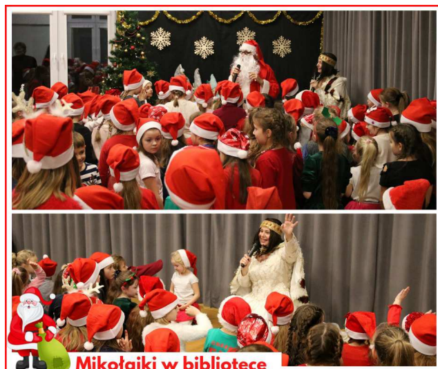
Mikołajki w bibliotece

Dokładnie 6 grudnia o godzinie 17:00 dzieci tłumnie umościły się na dywanie, przepięknie ubrane z dominacją koloru czerwonego i pełne radości, ale też wyczekiwania co też się zaraz wydarzy. Najpierw otrzymały czerwone mikołajkowe czapeczki, bo przecież każdy z nas może być Mikołajem. Kolejnym punktem było przedstawienie w wykonaniu teatryku KRAK - ART. Na scenie pojawił się doktor Dolittle i jego zwierzęta. Mali widzowie bardzo chętnie angażowali się w pomaganie doktorowi i leczenie zwierząt. Ale oczekiwanie na Mikołaja dawało o sobie znać i najmłodszy nie mogli usiedzieć na miejscu mimo piosenek i zabaw. W końcu rozległo się głośne hurra! Przybył Mikołaj! Zajął zaszczytne miejsce przy bibliotecznym kominku i z każdym dzieckiem chciał porozma-