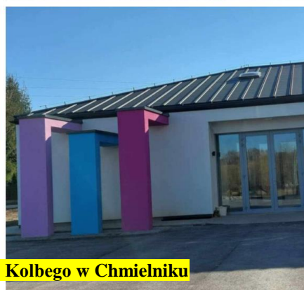
Rozbudowa i przebudowa Szkoły Podstawowej nr 3 im. Św. M.M. Kolbego w Chmielniku