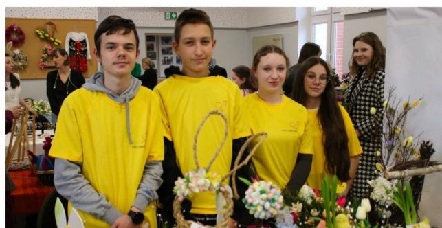
I CHMIELNICKI KIERMASZ WIELKANOCNY