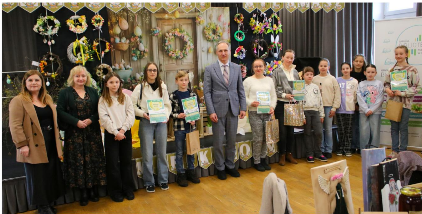
I CHMIELNICKI KIERMASZ WIELKANOCNY

Gminna Biblioteka Publiczna w Chmielniku