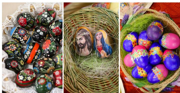
I CHMIELNICKI KIERMASZ WIELKANOCNY

Tradycyjna forma kermasu została nieco zmieniona poprzez organizację warsztatów wielkanocnych dla dzieci. I to była dobra zmiana łącząca tradycję z nowoczesnością. W tworzenie wielkanocnych dekoracji zaangażowały się nie tylko dzieci, ale również rodzice, a nic nie zastąpi czasu spędzonego razem i to jeszcze kreatywnie. Dodatkową atrakcją było rozstrzygnięcie konkursu na „Wianek Wielkanocny” podzielony na 3 kategorie: dzieci z klas 0-III, dzieci i młodzież z klas IV – VIII, młodzież ze szkół średnich i dorośli. Komisja oceniająca miała ogromne trudności z wyborem zwycięzców. Wszystkie prace były wyjątkowe, ale na ostateczny wynik wpłynęła przede wszystkim oryginalność.